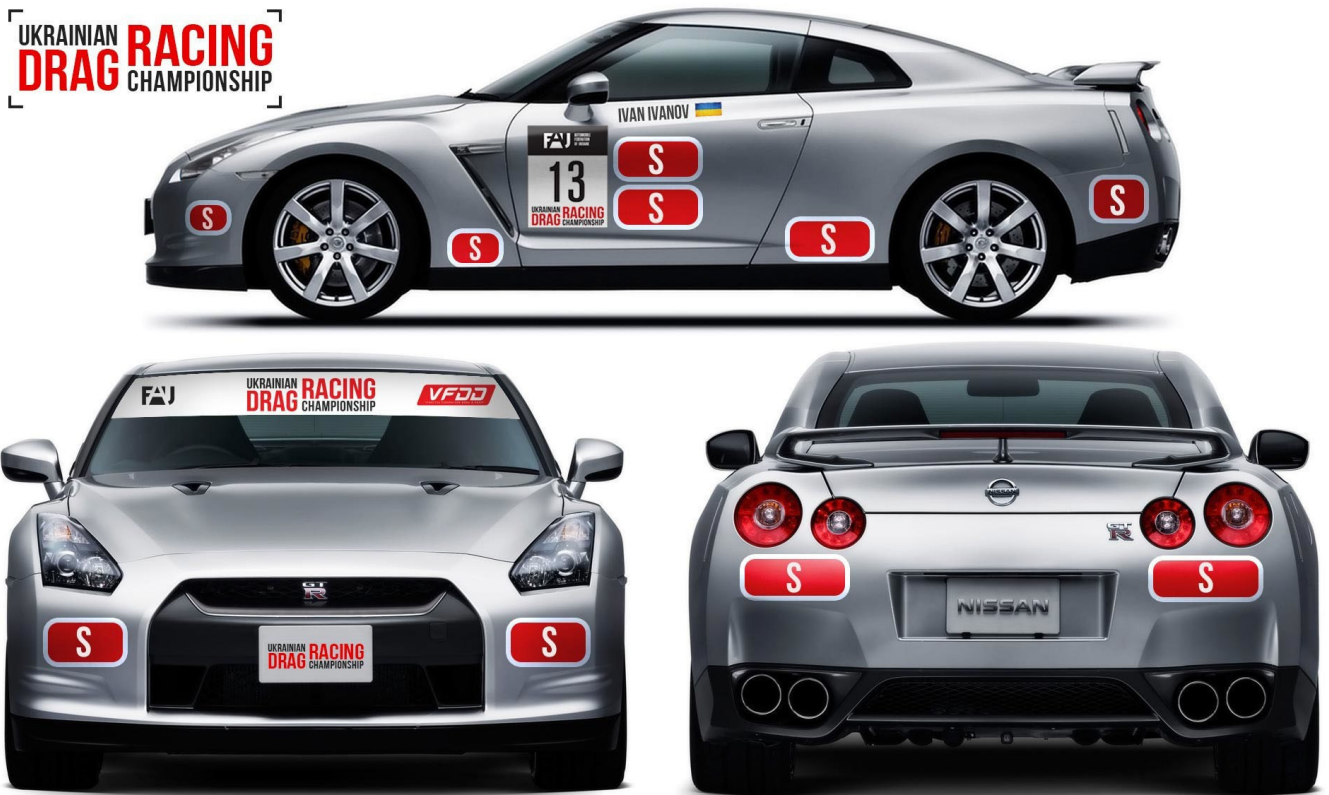
Наклейка на лобове скло.

За порушення цієї вимоги Представник пеналізується грошовим Пеналізаціям, розмір якого повинен бути вказаний в Індивідуальному Регламенті змагання. Але такий Пеналізація не може перевищувати розмір Заявочного внеску до відповідного класу (у випадку, коли заявочні внески відсутні – відповідно до стандартного внеску), у якому допущено даний автомобіль.